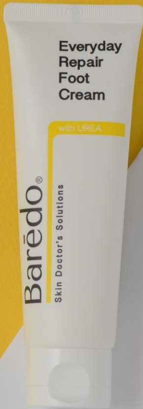
바레도 에브리데이 리페어 풋크림 Baredo Everyday Repair Foot Cream