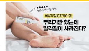
#발각질0초케어템 부리기만 했는데 발각질이 사라진다? [발각질 걱정 끝] 바레도 10초 풋세럼으로 당당한 두 발을 선물해봐요! 뷰티 | 스키노메이선