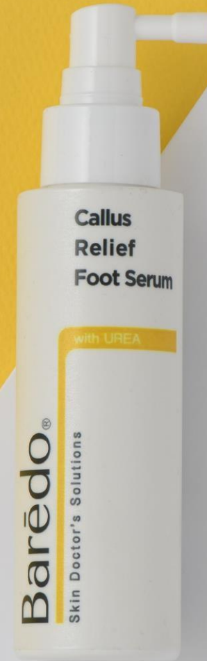
바레도 캘러스 릴리프 풋세럼 Barēdo Callus Relief Foot Serum

발의 신체 구조에 가장 잘 맞는 국내산 스페셜 스프레이 사용으로 제품의 낭비를 줄이고 필요 부위 관리가 가능합니다.