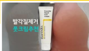
발각질제거 풋크림추천 [5점앵콜/후기] 발각질 고민? 끈적임없는 풋크림의 놀라운 결과 뷰티 | 스키노메이선