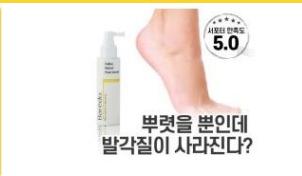
부렸을 뿐인데 발각질이 사라진다? [5점 앵콜]척 뿌리고 속 밀면 자극없이 각질이 우수수~ 발각질 끝장템! 뷰티 | 스키노메이선