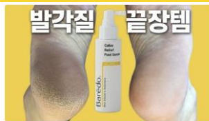
발각질 끝장템 후기: 과장이라 생각했는데 하루만에 효과가 나타나났어요! <발각질 끝장템> 뷰티 | 스키노메이선