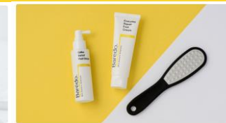
만점앵콜, 후기:과장이라 생각했는데 하루만에 효과 나타났어요! 발각질끝장템 뷰티 | 스키노메이선