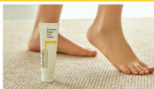
[발각질제거] 미웠던 발관리, 끈적임 없는 바레도 크림으로 시작하세요 뷰티 | 스키노메이선