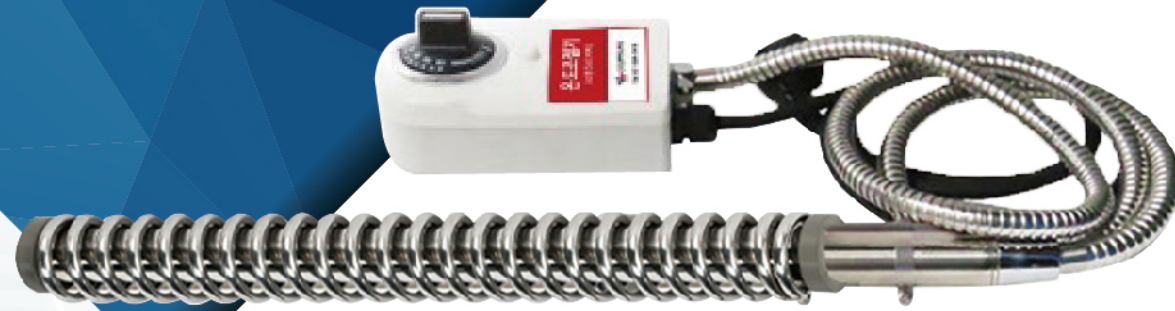
전원코드 길이 1.5M 스텐후렉시블 길이1.3M