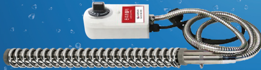
전원코드 길이 1.5m 스텐후렉시블 길이1.3m